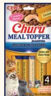
Pollo con Formaggio