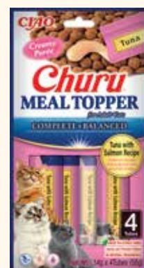
Tonno con Salmone