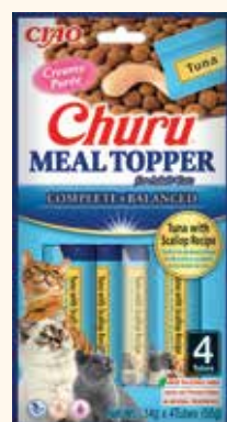
Tonno con Capesante